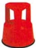
Taburete con ruedas "TACO"