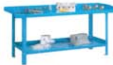
Bancos metálicos desmontables