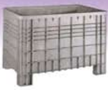
Contenedores de plástico