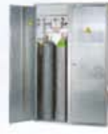
Armarios y carretillas para botellas de gas