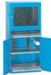
Armarios para equipos informáticos