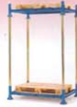
Estantería metálica desmontable