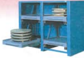
Estantería serie AR