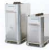
Recipientes para almacenamiento de aceites/gasoleo