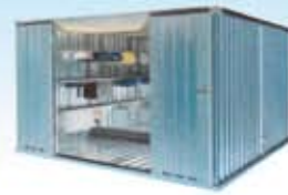
Almacenes para el exterior