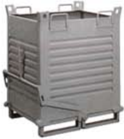
Contenedores con fondo abatible