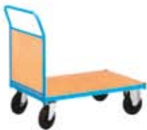
Carros serie FCE