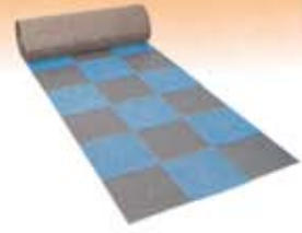
Tarimas y suelos plásticos