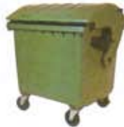
Contenedores para residuos