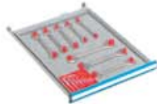
Subdivisión de cajones