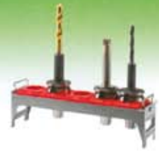
Componentes de armarios carros y estanterías porta-herramientas