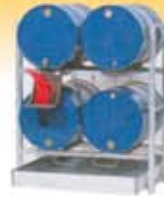
Estanterías para almacenamiento y trasvase