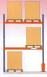
Estantería de paletización