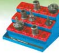
Sistemas de almacenamiento de herramientas