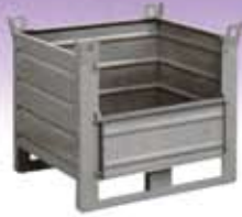
Contenedores de chapa