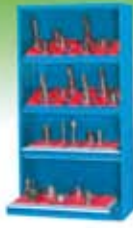
Estanterías y armarios porta-herramientas