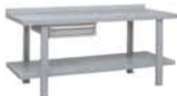
Bancos metálicos para grandes cargas