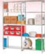
Estantería serie ST