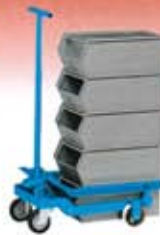
Carros de elevación y transporte