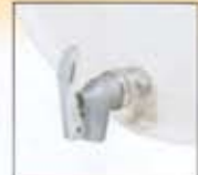
Accesorios para barriles