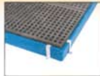
Entarimado colector en acero o polietileno