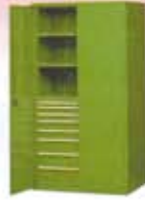
Estantería serie SR