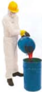
Equipos de protección individual