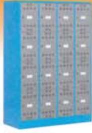
Taquillas metálicas monobloque