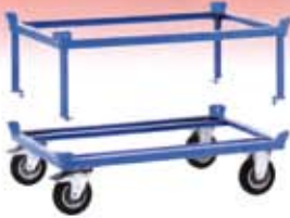
Rodador de palets