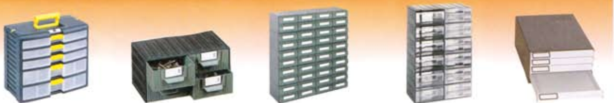
Sistema modular STORE AGE