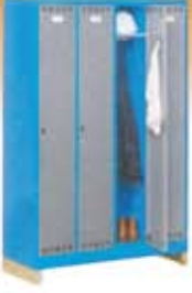
Roperos metálicos monobloque