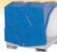
Depósitos para barriles y KTC/IBC