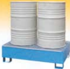
Cubetos de retención