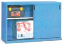
Armarios con puertas correderas