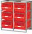
Estantería serie ED