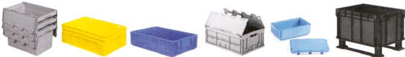
Serie DELTA. Contenedores apilables y encajables