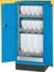
Armario para líquidos