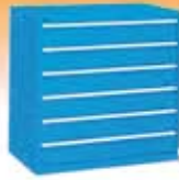
Armarios con cajones serie AG