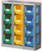
Estantería serie TR