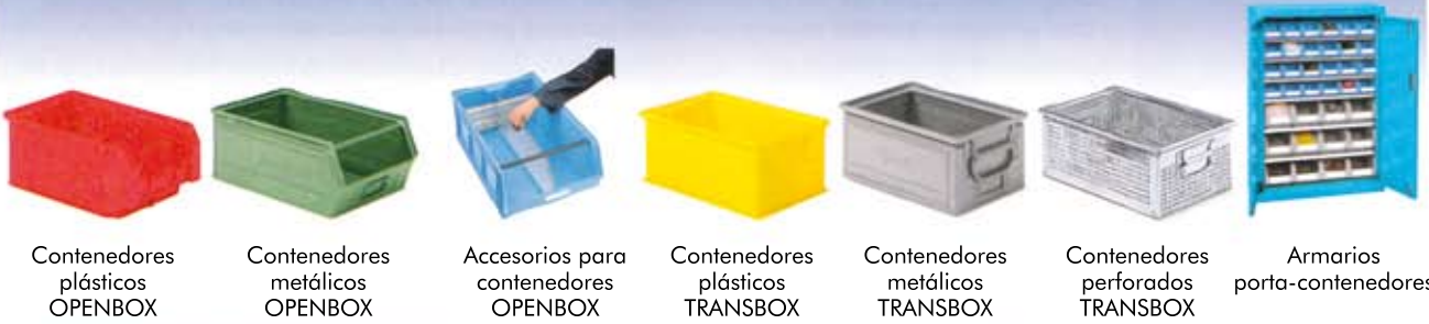
Contenedores plásticos OPENBOX