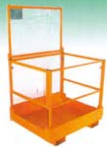
Cabinas para elevación mediante carretilla