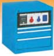
Armarios con cajones serie FLEXA