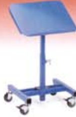
Posicionadores de material