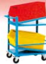
Carros serie FCR