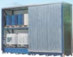
System container para productos peligrosos