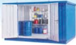
Modul container para productos peligrosos