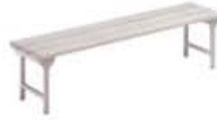
Accesorios para roperos y taquillas