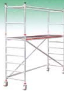
Andamios de aluminio