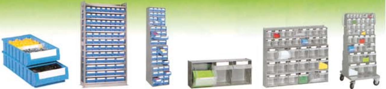
Contenedores plásticos MULTIBOX