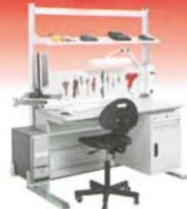
Bancos UNIMOD serie DYNAMIC