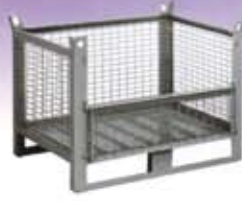
Contenedores de malla