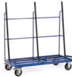
Carros porta paneles y barras