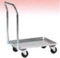
Carros serie FCP