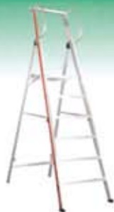
Escaleras de aluminio