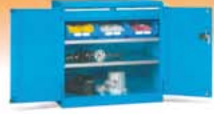
Armarios con puertas batientes