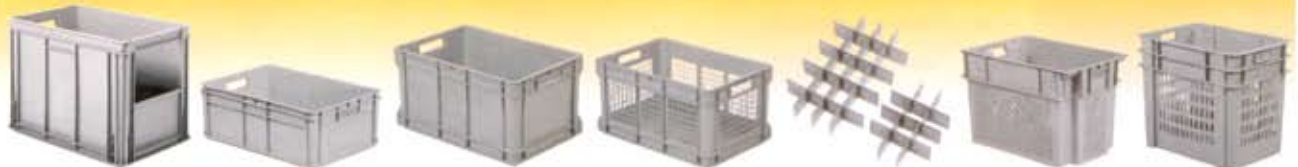
Serie ATHENA 300x200/400x300 600x400/800x600