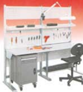
Bancos UNIMOD serie COMFORT