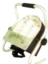
Lámparas de luz fría