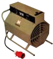
GENERADORES DE CALOR