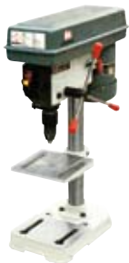
TALADROS DE COLUMNA