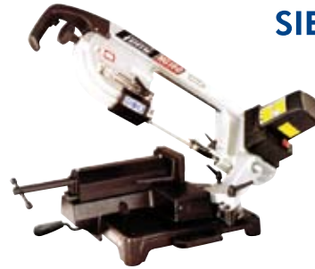
SIERRAS DE CINTA Y TRONZADORAS PARA METAL