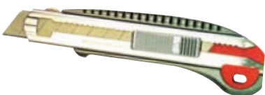
◀ Cutters y cuchillas profesionales