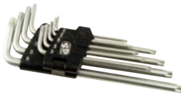
◀ Juegos de llaves y minillaves Allen y Torx