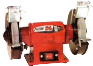
ESMERILADORAS Y LIJADORAS