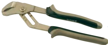
◀ Alicates picoloro