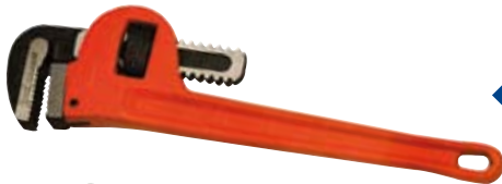
◀ Llaves Stilson