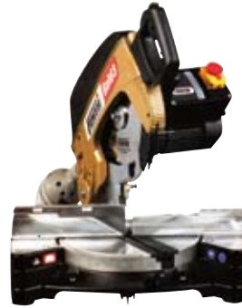
TRONZADORAS PARA ALUMINIO Y MADERA