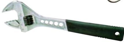
◀ Llaves ajustables