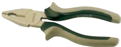
◀ Alicates profesionales