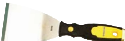
◀ Espátulas y rascadores