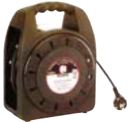
ENROLLADORES DE CABLE