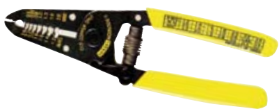
◀ Alicates pelacables