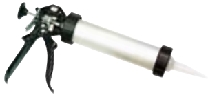
PISTOLAS DE SILICONA