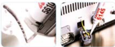
SELLADO Y UNIÓN FLEXIBLE