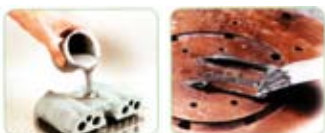
COMPUESTOS CON RELLENOS METÁLICOS