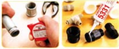
SELLADO DE ROSCAS Y TUBERÍAS