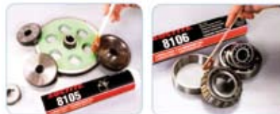
TRATAMIENTO SUPERFICIAL Y ANTICORROSIÓN