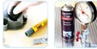
PRODUCTOS PARA REPARACIONES DE EMERGENCIA