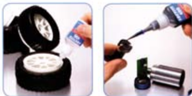
SELLADO Y UNIÓN